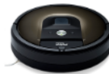
Un robot aspirateur