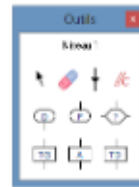
RobotProg et son langage