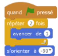
mBlock et son langage