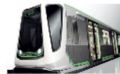
Un métro sans conducteur

26 millions de robots domestiques devraient se vendre dans le monde entre 2015 et 2019 pour répondre à nos nombreux besoins.